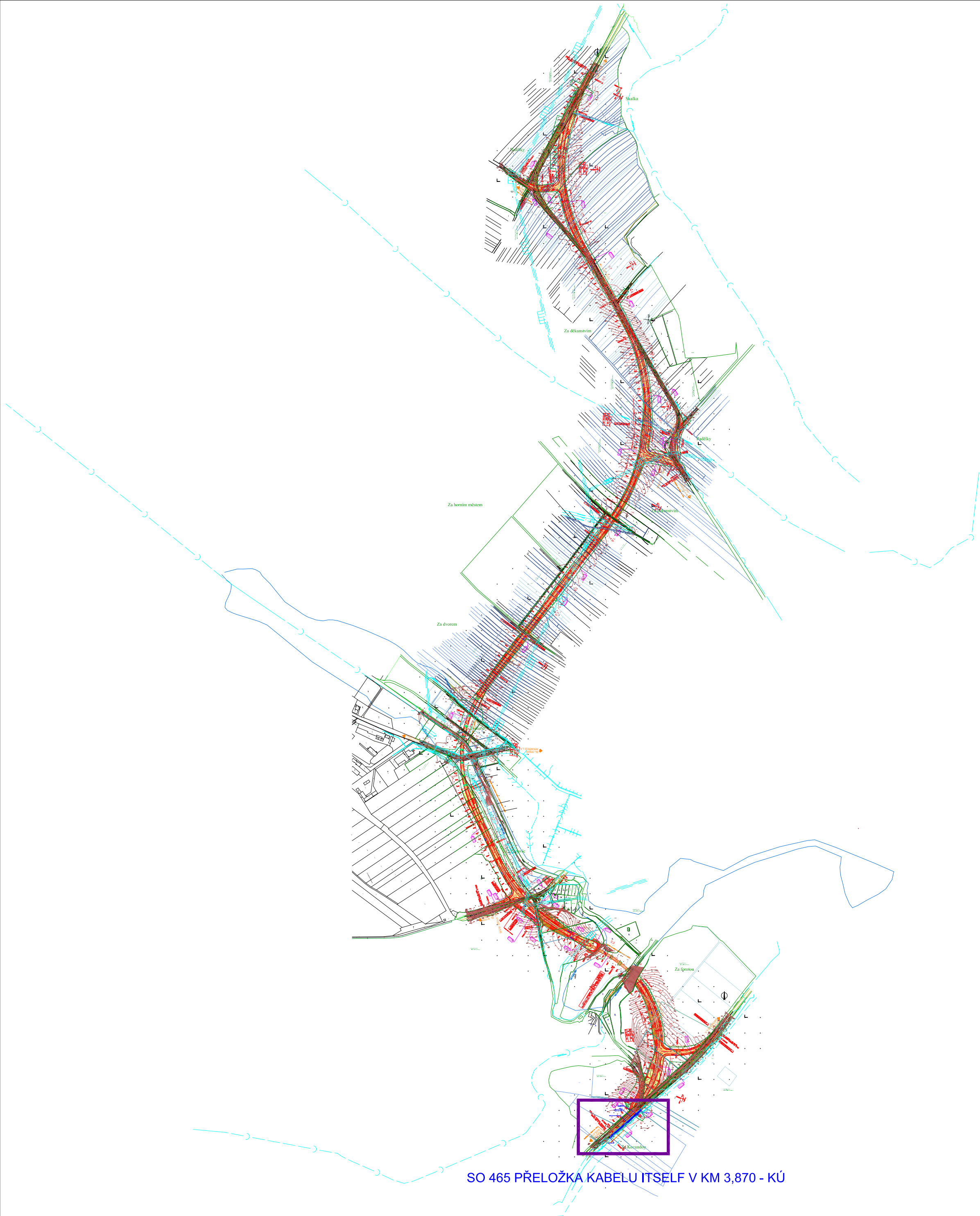
SO 465 PŘELOŽKA KABELU ITSELF V KM 3,870 - KÚ